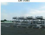
Les centrales Air-Air de Production de froid