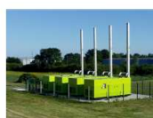
Les groupes électrogènes